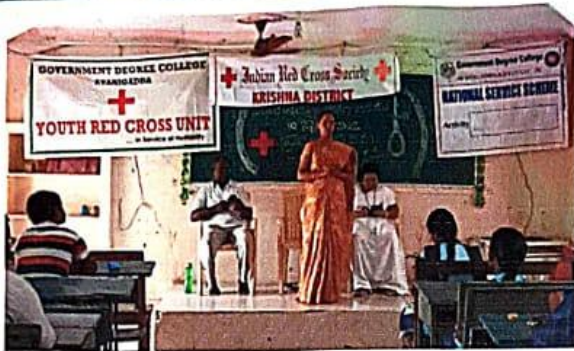
FIRST AID DAY

World first aid day & World suicide day control Day organised by NSS on 10/9/22.